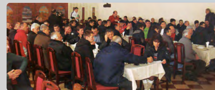
Prezentacija u Belotiću

Organizovanje 40 edukativnih prezentacija