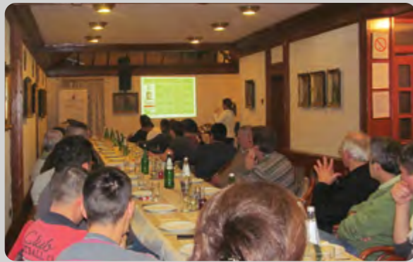
Prezentacija u Kikindi