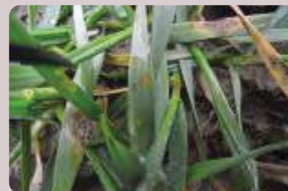
Simptomi rđe i pegavosti lista