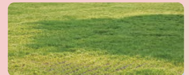
Posledice nepravilnog đubrenja

U proseku (za 11 godina) gubitak u proizvodnji kukuruza, računajući izgubljeni prinos je 397.647 evra. Kada se u ove gubitke uračuna pogrešno đubrenje sa P i K, gubici u pojedinim nepovoljnim godinama mogu da budu i do preko 128 miliona ili u povoljnim do 35 miliona evra.