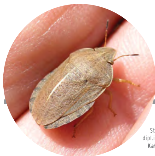
Stručna podrška: dipl.ing zaštite bilja Katarina Radonić PSS Vrbas