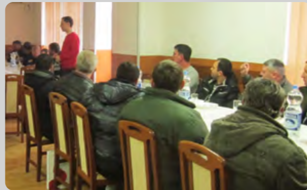
Prezentacija u Šidu

Za sve informacije, savete i eventualne nedoumice, pozovite stručne saradnike AGROTIM-a VICTORIA LOGISTIC.