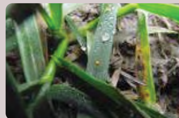
Simptomi lisne rđe na listu pšenice

Na dosta lokaliteta se i dalje uočava velika aktivnost poljskih glodara koja je u blagom porastu, a broj aktivnih rupa se kreće od 5 do 50 rupa po hektaru. Posebno je potrebno obratiti pažnju na parcele pšenice koje su posejane posle šećerne repe, lucerke i soje. Na parcelama gde su predusevi suncokret i kukuruz, bilo je u proseku 5 rupa po hektaru.