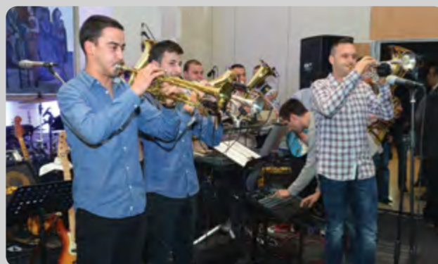
*Slike sa Svečane večere možete pogledati u galeriji na sajtovima www.agrotim.rs i www.victorialogistic.rs