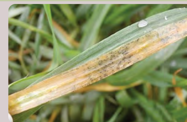
Simptomi sive pegavosti lista pšenice