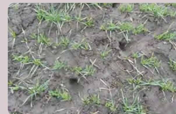
Aktivne rupe od poljskih glodara u usevu pšenice

Preporuka svim poljoprivrednim proizvođačima je da redovno obilaze parcela pod strnim žitima u cilju utvrđivanja broja aktivnih rupa po hektaru. Na svim parcelama na kojima u prethodnom periodu nije bilo primene rodenticida ili je broj aktivnih rupa veći od 5 po hektaru, potrebno je uraditi tretman rodenticidima po stabilizaciji vremenskih uslova.